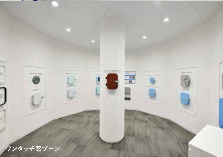
ワンタッチ窓ゾーン