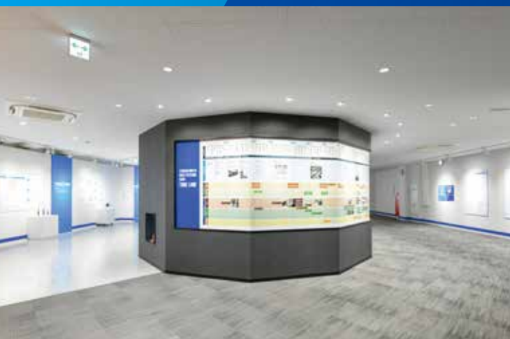
バルクタイムライン