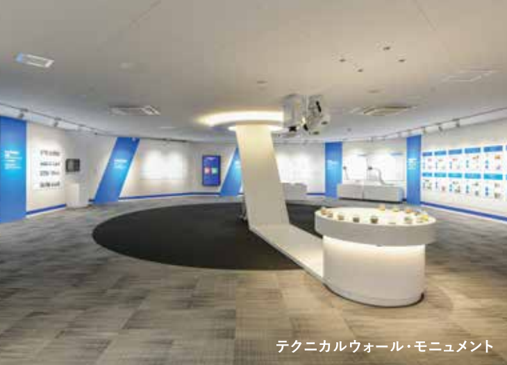
テクニカルウォール・モニュメント