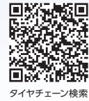
タイヤチェーン検索