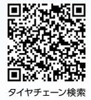
タイヤチェーン検索