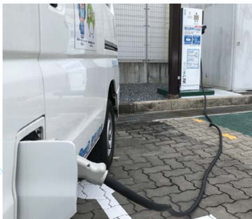
京都府長岡京市 中央公民館市民ひろば ：避難場所に給電