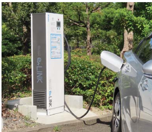
京都府京田辺市 コミュニティーホール ：災害対策拠点に給電