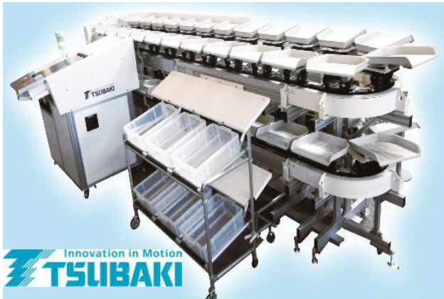
リニソートSC (2段式ソーター)