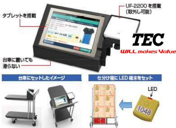
RFID対応ピッキングカートシステム